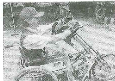
これがハンドサイクル自転車